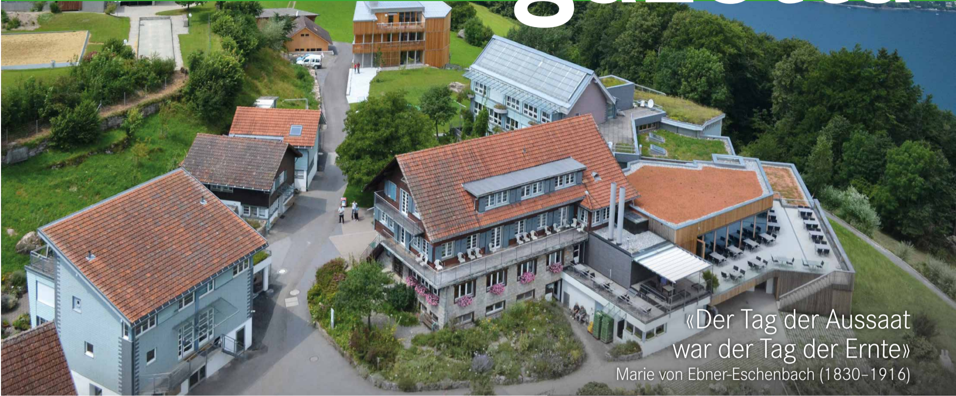
«Der Tag der Aussaat war der Tag der Ernte» Marie von Ebner-Eschenbach (1830–1916)