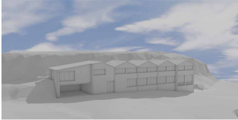
Machbarkeitsstudie Wäscherei und Bäckerei Menzihuus (Visualisierung: R. Wülfling)

Die Bäckerei und die Wäscherei des Menzihuus stossen an ihre Grenzen. Die bestehende Infrastruktur kann der Nachfrage nach unseren Arbeitsplätzen und Produkten nicht mehr gerecht werden. Eine Machbarkeitsstudie klärt die Möglichkeiten auf dem Platz Lihn in Filzbach.