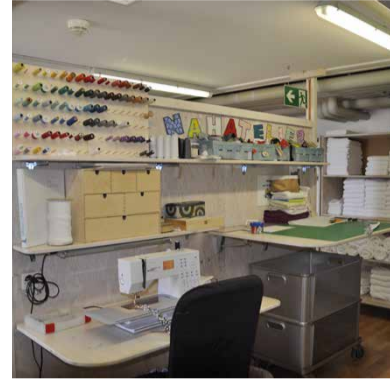
In der heutigen Wäscherei herrschen enge Platzverhältnisse.

Mit dem Neubau schaffen wir eine nachhaltige Zukunft für das Menzihuus. Dort finden mehr Menschen eine Arbeit und sinnstiftende Tagesstruktur, und wir können der hohen Nachfrage nach unseren Arbeits-