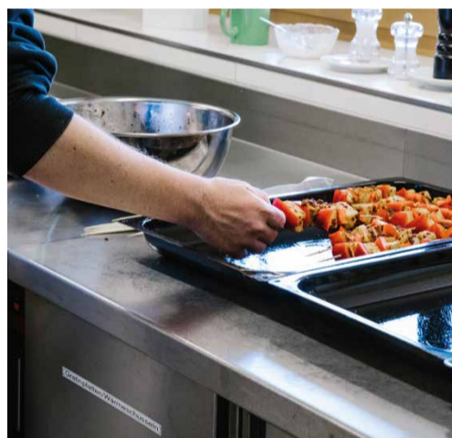
Aufbautraining in den Werkstätten des Menzihuus und im Hotel Lihn.