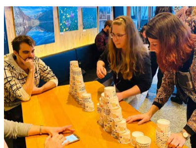
Voller Einsatz an der «Lihnpiade».

Restaurant serviert wurde. An verschiedenen Posten wie Lihn-Pong, Black Jack, Darts, Türmli bauen und Pantomime waren Geschicklichkeit, Mut und Geduld gefragt. Alle waren voller Tatendrang und Freude, und so wurde gezielt, gebaut, gespielt und «pantomiert».